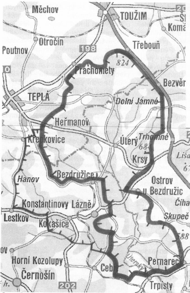
Doporučená (silně) a maximální (slabě) varianta navrhovaného přírodního parku Tepelské vrchy - Úterský potok.

nadzemní vedení jsou mimo navrhovaný přírodní park (netýká se vedení menších rozměrů). Nepříjemnými a bohužel častými dominantami krajiny jsou rozlehlé zemědělské areály na okrajích obcí z období budování socialistické velkovýroby v 2. polovině 20. století. Z té doby pochází i členění zemědělských pozemků do velkých lánů, bezesporu další negativní dopad na krajinu, dnes