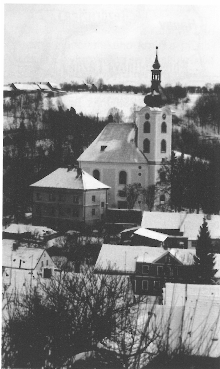
Městečko Úterý s barokním kostelem sv. Jana Křtitele.

jen částečně se uplatňují v krajinných pohledech další stožáry např. u Bezdružic a nad Úterým. Technickou dominantou mimo navrhovaný přírodní park, avšak viditelnou na velkou vzdálenost, je samozřejmě televizní vysílač u Krašova. Vzdušné vedení VVN se uplatňuje již dnes ve stávajícím přírodním parku Hadovka (bohužel v dominantní poloze mezi Milkovským čihadlem a Ovčím vrchem, totéž vedení překračuje mj. I. zónu CHKO Slavkovský les v okolí Křížků), v nově vymezeném území tvoří část západní hranice. Tentýž případ je na východním okraji, kde vedení běží v dominantní poloze po zemědělských pozemcích mezi údolím Dolského potoka a silnicí Karlovy Vary – Plzeň. Další výrazně dominantní